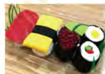
布でお寿司を作ろう (ゆき)