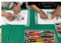
プラ板キーホルダー作り (オカダ・カコ / アトリエ風趣)